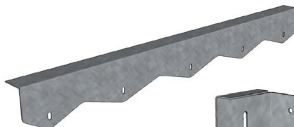
Vinkel for døråbning