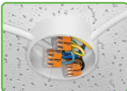
Forskellige tilslutningsmuligheder i samledåser