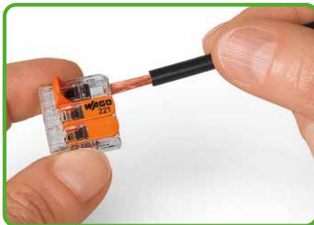
Tilslutning af ledere: Klemmen åbnes med vippepalen, og lederen isættes.