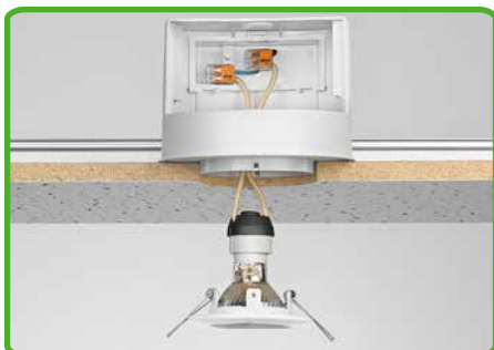
Forskellige tilslutningsmuligheder i samledåser